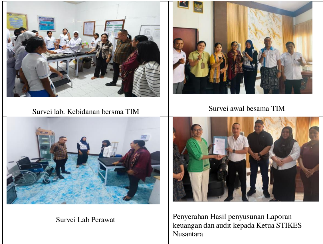
Gambar 1. Edukasi Literasi Financial Technology (Fintech) dan Pembukuan.

berkala setiap akhir bulan. Gambar 1 mengilustrasikan proses pendampingan langsung dan rekayasa alur sistem informasi akuntansi baru yang dilakukan bersama tim keuangan STIKES Nusantara demi mewujudkan asas akuntabilitas finansial.